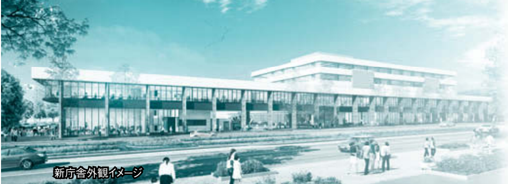
新庁舎外観イメージ