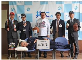
政策推進部 いい仕事をするため。休。遊。楽。