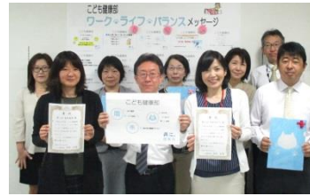
子ども健康部 こども健康部 ワーク・ライフ・バランスメッセージ