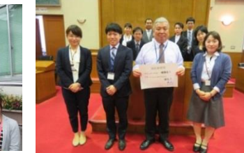
議会事務局 やるときややる！頑張る！でも、やらんときはやらん。休む！