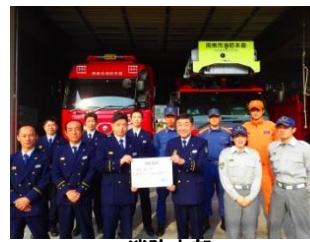
消防本部 消防本部は、ワーク・ライフ・バランスの充実を目指します！