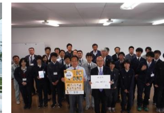
建設部 さあ、帰ろう！