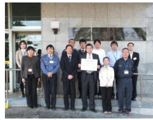
新南陽総合支所 早く、帰ろうDAY。 我々は、常に家庭で充電し、パワーアップを図り住民サービスの向上に努めます。