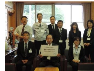
熊毛総合支所 家庭や地域を明るく元気におもしろく！