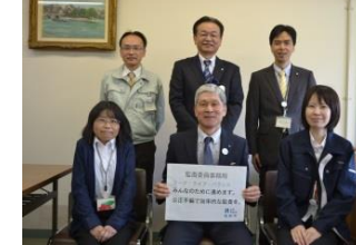
監査委員事務局 ワークライフバランス みんなのために進めます。公平不偏で効率的な監査を。