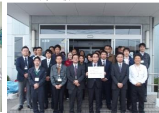
経済産業部 任せてね！カバーし合えば、仕事は順調、休日も充実！