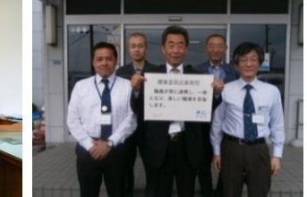
農業委員会 職員が常に連携し、一体となり、楽しい職場を目指します。