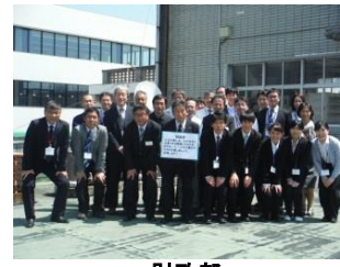
財政部 人生を楽しみ、生き生きと仕事できる職場とするため、まずは一人一人の仕事のやり方を見直しましょう。応援します！