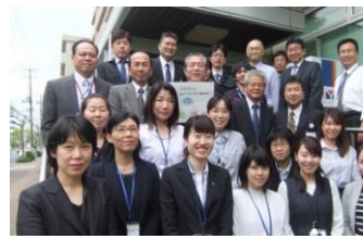
教育委員会 未来(あす)に向かって“共に”育む周南の子供。