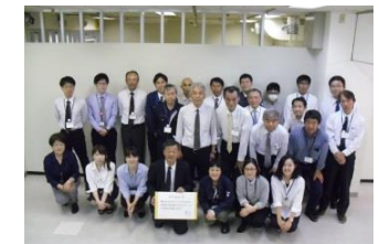
都市整備部 魅力あるまちづくりのために、効率的な仕事とプライベートの充実を目指します！