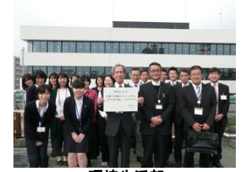
環境生活部 仕事と家庭のスイッチを上手に切り替え、エコライフ。