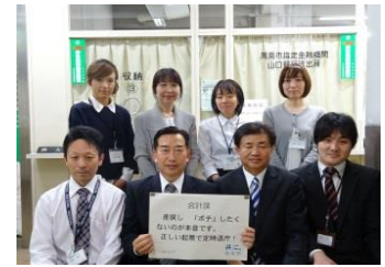
会計課 差戻し「ボチ」したくないのが本音です。正しい起票で定時退庁！