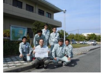
上下水道局 「チームワーク」と「めりはりのある働き方」で、満足度100%！！