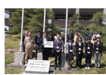
鹿野総合支所 「888 バランス」で行こう！ 仕事 家族 健康