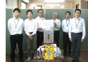
選挙管理委員会 政魂一票 幸笑家族