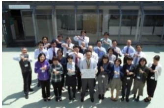
福祉医療部 仕事にやりがいがある。健康で充実した生活が大切。私たちは、どちらも手に入れます。