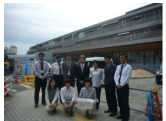
中心市街地整備部 業務はより効率的に！余計な資料はつくらず、家庭で過ごす時間をつくらう！