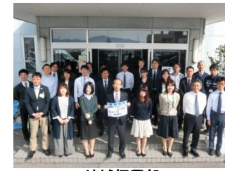
地域振興部 仕事とプライベートの二刀流。オンもオフも全力投球！