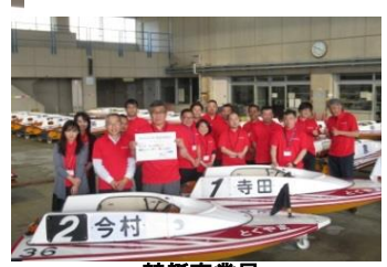
競艇事業局 これから先。きっと、ずっと、もっと楽しく繰出しっぱい 夢いっぱい