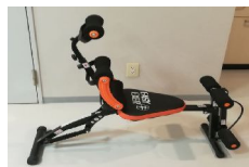
健康器具 シットアップベンチ