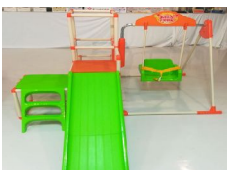
ジャングルジム 滑り台