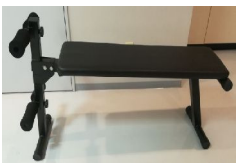
健康器具 マルチベンチ