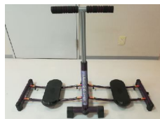
健康器具 レッグマジック