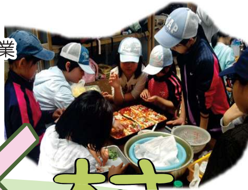
以前の活動の様子